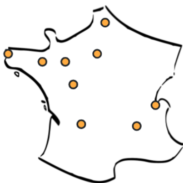
Carte des groupes Expérimentation Coloc'Auto, 2023

L'expérimentation de Coloc'Auto par des citoyen.ne.s a débuté au printemps 2023 dans plusieurs régions de France métropolitaine. L'objectif de l'expérimentation est d'accompagner une dizaine de groupes dans la mise en commun de leurs véhicules (1 à 3 véhicules partagés, pour des communautés allant de 2 à 10 membres).